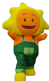
公社イメージキャラクター 『ほっほ』